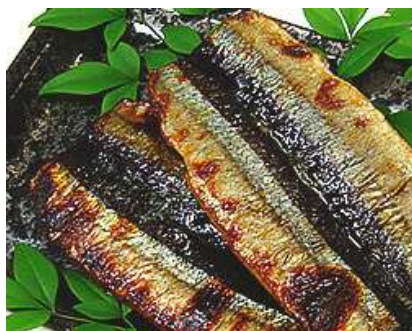
さんま味噌醤油干し焼き

※企画：魚種・原産地・数量・カット・開き・骨抜き・ごまあり、なし等 ご相談下さい。