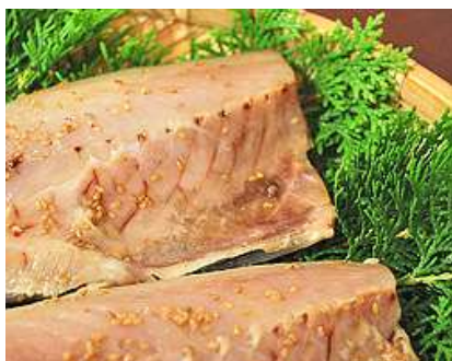
あじ文化干/一夜干 原産地：国産・ノルウェー ・アイルランド

厳選された魚をミネラル豊富な塩水に漬け込み遠赤外線乾燥で仕上げました。 塩分は控えめの1.2%です。 ※企画：魚種・原産地・数量・カット・開き・骨抜き・ごまあり、なし等はお相談下さい。