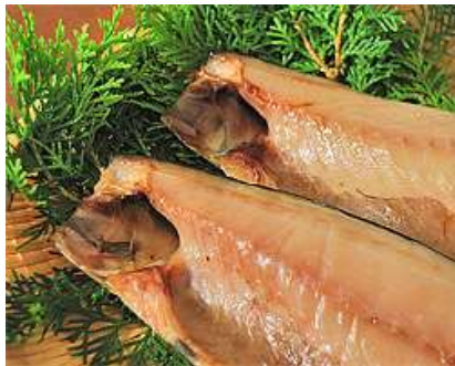
さば灰干 原産地：国産・ノルウェー等