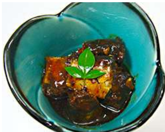
いわし角煮 原産地：国産