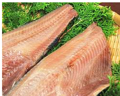
ほっけ文化干/一夜干 原産地：アメリカ・ロシア