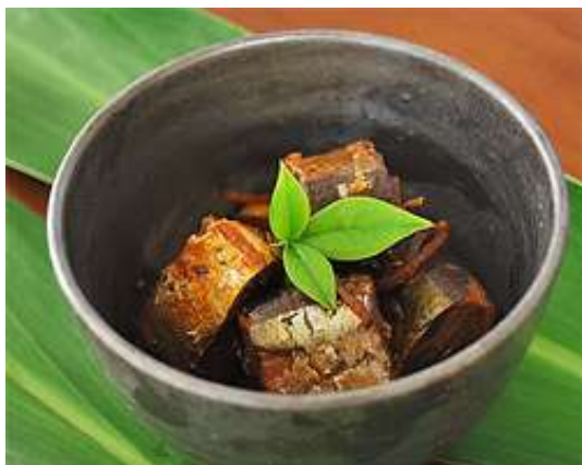
さんま角煮 原産地：国産