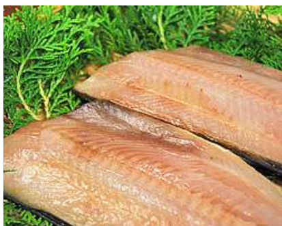
ほっけ灰干 原産地：アメリカ・ロシア

魚を1枚ずつ灰と灰の間に手作業でサンドウィッチ状にならべます。 余分な水分だけを取り魚のうまみ成分を残す昔ながらのこだわり干物です。 ※企画：魚種・原産地・数量・カット・開き・骨抜き等はお相談下さい。