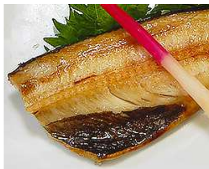
ほっけ白醤油干し焼き