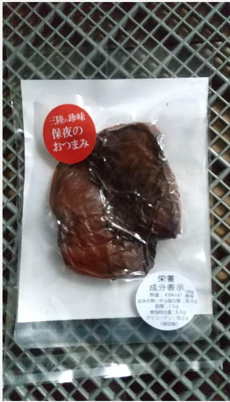
おつまみ、ホヤ一夜干し