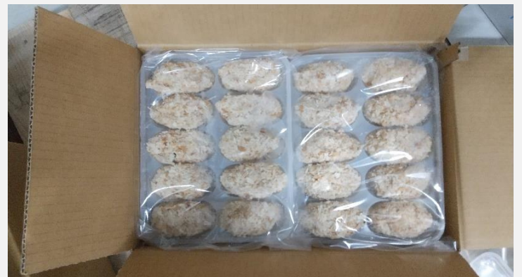
冷凍 牡蠣フライパック