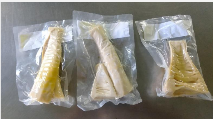
竹の子の水煮真空パック