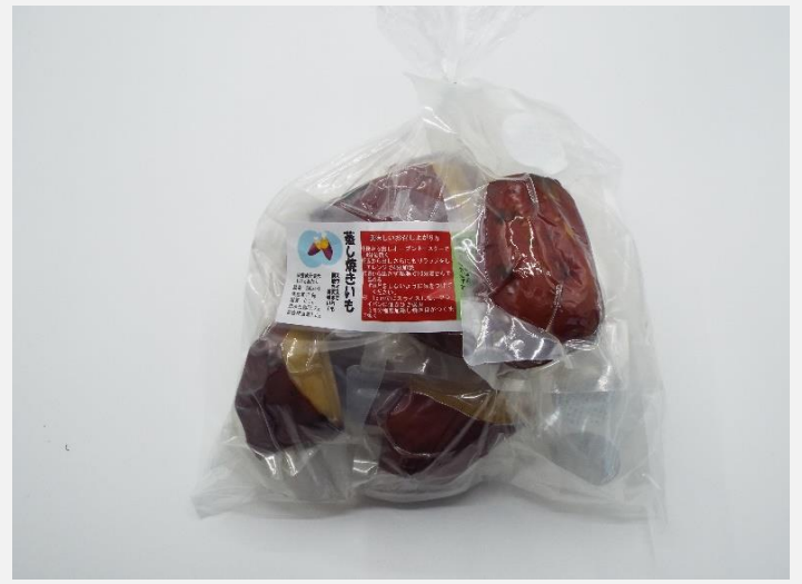
蒸し焼き芋 レトルトパック