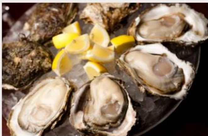
冷凍生食用かき(殻付き25個セット・牡蠣剥きナイフつき)