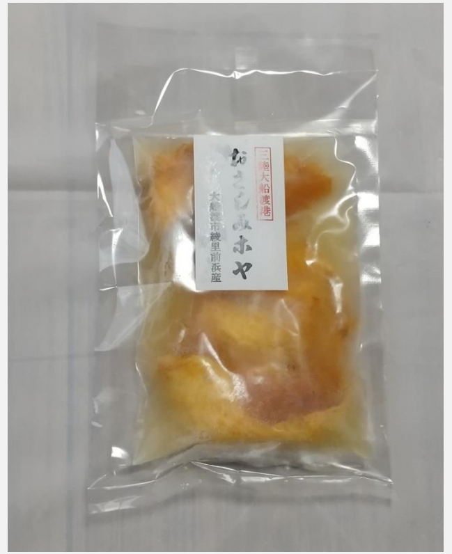
お刺身ホヤ冷凍パック