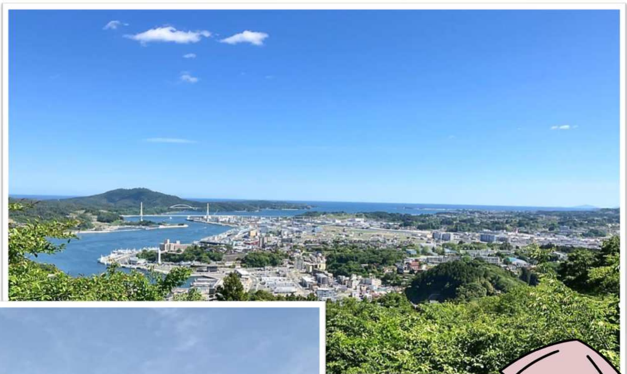
安波山から見た気仙沼湾