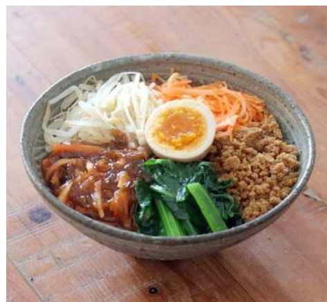
もずくキムチのピビンバ