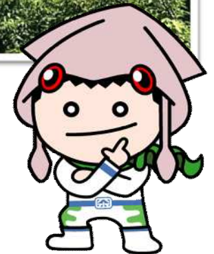
ハチヨウ販売促進 切り込み隊長 「いかおくん」