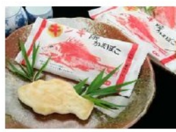
キンキ焼かまぼこ