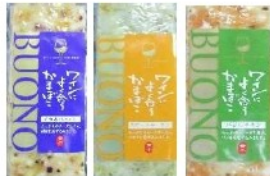
ワインによく合うかまぼこ