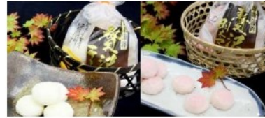
珍味蒲鉾贅沢シリーズ (チーズ・明太マヨ)