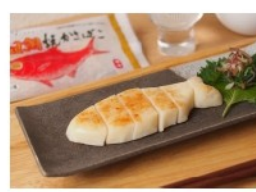
金目鯛焼かまぼこ