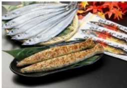
さんまぼーぼー焼風蒲鉾