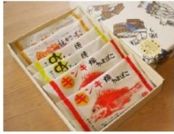
焼きかまぼこ 箱入