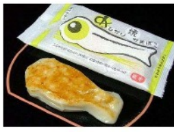
めひかり焼かまぼこ