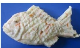
冷凍かまぼこ 鯛型