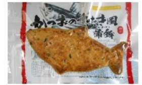
かつおのたたき風蒲鉾