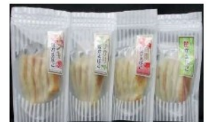
チャック付シリーズ