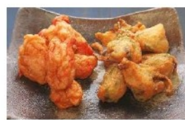
冷凍揚げかまぼこ各種