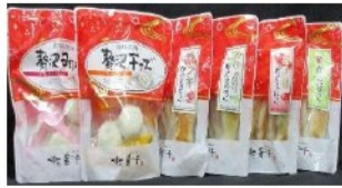
スタンドパックシリーズ