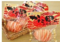
かに甲らかまぼこ