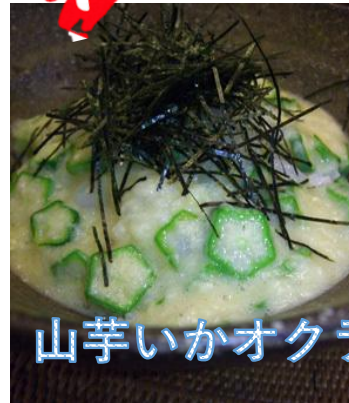
山芋いかオクラ丼！