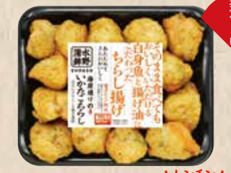
いかたちらし 具だくさんのひとくち揚げ蒲鉾。 規格 120g入 入り数 6パック/1箱 ■パックサイズ/125×148×17mm