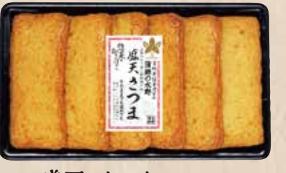
盛天 さつま 上質のすり身だからできる、やさしい食感のさつま揚げ。 規格 6枚入 入り数 6パック/1箱 ■パックサイズ/113×194×15mm