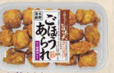
ごぼうあられ 香ばしく旨味あふれる美味しさ。純正胡麻油で仕立てました。 規格 140g入 入り数 6パック/1箱 ■パックサイズ/108×172×17mm