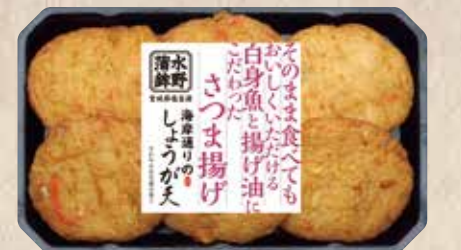
海岸通りのしょうが天 さわやかなしょうがの香りとほのかな甘味。 規格 6枚入 入り数 6パック/1箱 ■パックサイズ/120×200×30mm