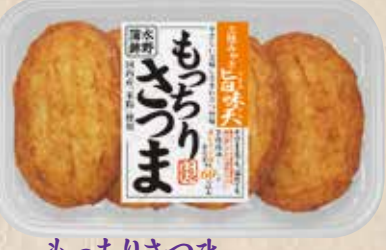
もっちりさつま 国内産米粉を使用してもっちりとした仕上げたベーシックなさつま揚げです。 規格 4枚入 入り数 6パック/1箱 ■パックサイズ/108×172×17mm