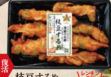
枝豆するめ するめと枝豆の食感と、味わいの珍味蒲鉾です。 規格 100g入 入り数 6パック/1箱 ■パックサイズ/114×167×18mm