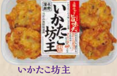
いかた坊主 いかたとタコの美味しさと食感のアクセント。彩りも豊かに仕上げました。 規格 6個入 入り数 6パック/1箱 ■パックサイズ/108×172×17mm