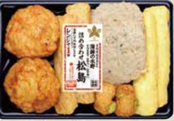
詰め合わせ 松島 いろんな味が楽しめる、ちよつと贅沢な盛り合わせ。 規格 6種10個入 入り数 6パック/1箱 ■パックサイズ/114×167×18mm