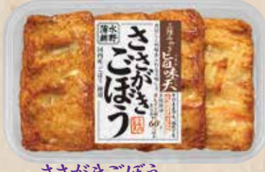
ささがきごぼう 国内産ごぼうを使用したささがきごぼうのしっかりとした美味しさ。 規格 4枚入 入り数 6パック/1箱 ■パックサイズ/108×172×17mm