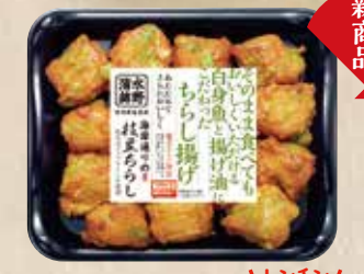
枝豆ちらし 台湾産枝豆のプリプリとした食感。 規格 120g入 入り数 6パック/1箱 ■パックサイズ/125×148×17mm