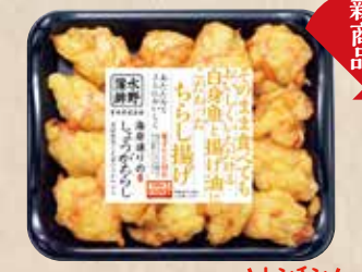
しょうがちらし 新鮮野菜と生姜のさわやかさ。 規格 120g入 入り数 6パック/1箱 ■パックサイズ/125×148×17mm