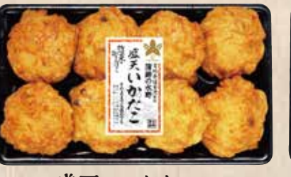
盛天 いかたこ 上質のすり身に、イカとタコの美味しさと食感をアクセントに。 規格 8個入 入り数 6パック/1箱 ■パックサイズ/113×194×15mm