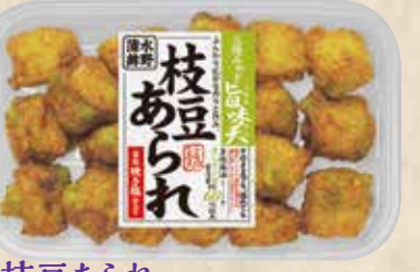
枝豆あられ ふんわり広がる香りと旨み。優しい風味の薄塩焼き仕立てです。 規格 140g入 入り数 6パック/1箱 ■パックサイズ/108×172×17mm