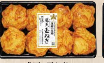
盛天 玉ねぎ 国内産の玉ねぎのさわやかな風味と甘味。 規格 8個入 入り数 6パック/1箱 ■パックサイズ/113×194×15mm