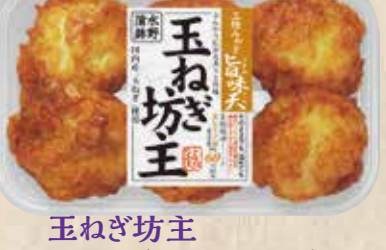
玉ねぎ坊主 もっちり揚げ蒲鉾に国内産玉ねぎのさわやかさを閉じ込めました。 規格 6個入 入り数 6パック/1箱 ■パックサイズ/108×172×17mm