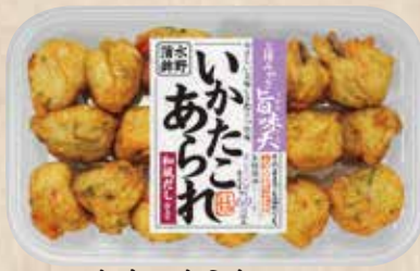
いかたこあられ 優しい美味しさ、きわだつ旨味。味わい深い和風だし仕立てです。 規格 140g入 入り数 6パック/1箱 ■パックサイズ/108×172×17mm