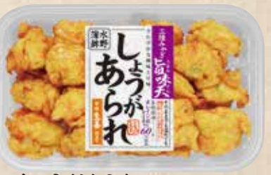
しょうがあられ さわやかな酸味と甘味。宮城県加工の甘酢生姜で仕立てました。 規格 140g入 入り数 6パック/1箱 ■パックサイズ/108×172×17mm