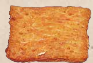
利久揚 規格 90g入 入り数 30枚入/1箱