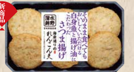
海岸通りのれんこん天 カリカリとしたれんこんの食感が楽しい惣菜揚げ蒲鉾。 規格 6枚入 入り数 6パック/1箱 ■パックサイズ/120×200×30mm