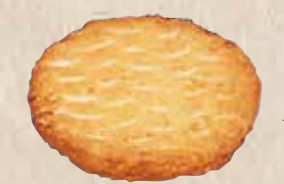
徳丸天 規格 60g入 入り数 50枚入/1箱