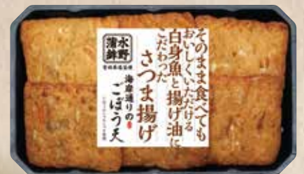
海岸通りのごぼう天 国内産ごぼうを使用したささがきごぼうのしっかりとした美味しさ。 規格 6枚入 入り数 6パック/1箱 ■パックサイズ/120×200×30mm

そのままおかずにも、おつまみに。 そのまま食べても美味しくいただける白身魚と揚げ油にこだわったさつま揚げです。 おかずやお弁当の一品にも、おつまみやおやつでも。