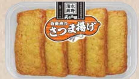
白身魚のさつま揚げ 上質のすり身をいかした飽きのこない味わい。 規格 5枚入 入り数 6パック/1箱 ■パックサイズ/108×172×17mm

ひとつひとつ丁寧に仕上げられた、手作りが美味しさを引き立たせます。水野の揚げ蒲鉾の美味しさの原点がここにあります。