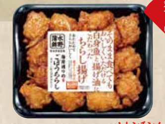
ごぼうちらし 香ばしい純正ごま油仕立て。 規格 120g入 入り数 6パック/1箱 ■パックサイズ/125×148×17mm